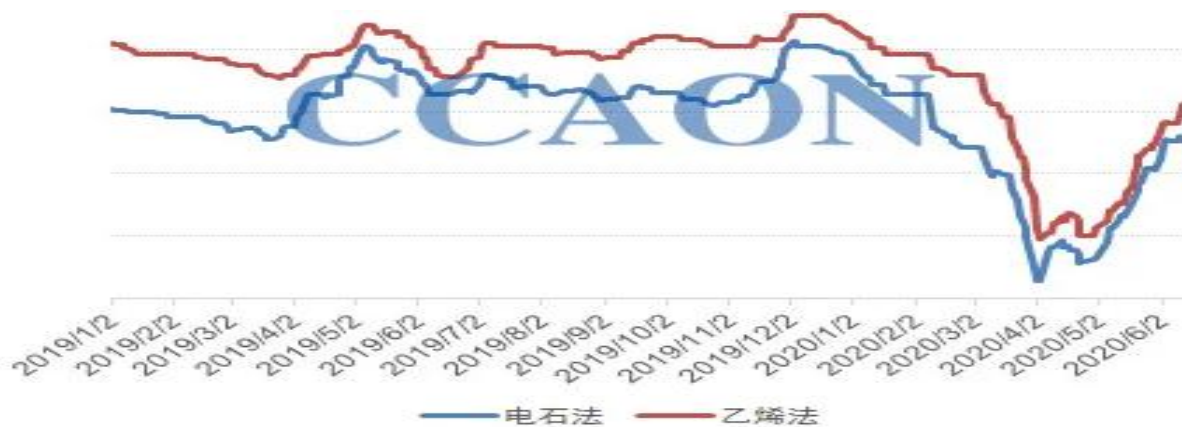
2019 年至今国内 PVC 市场走势图

需求方面，近段时间下游制品企业开工整体保持平稳状态，型材、管材行业的中大型企业开工在 8 成上下。当前有了解，接下来的 6 月后半月，有可能因淡季影响和赶工期已过，部分建筑塑料制品企业开工出现下调，但预期减产幅度不大。