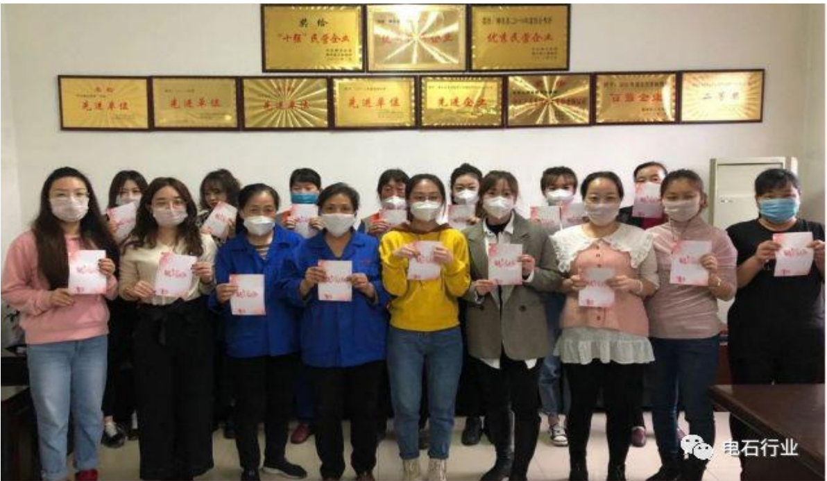
陕西神木能源电石公司的“巾帼英雄”们