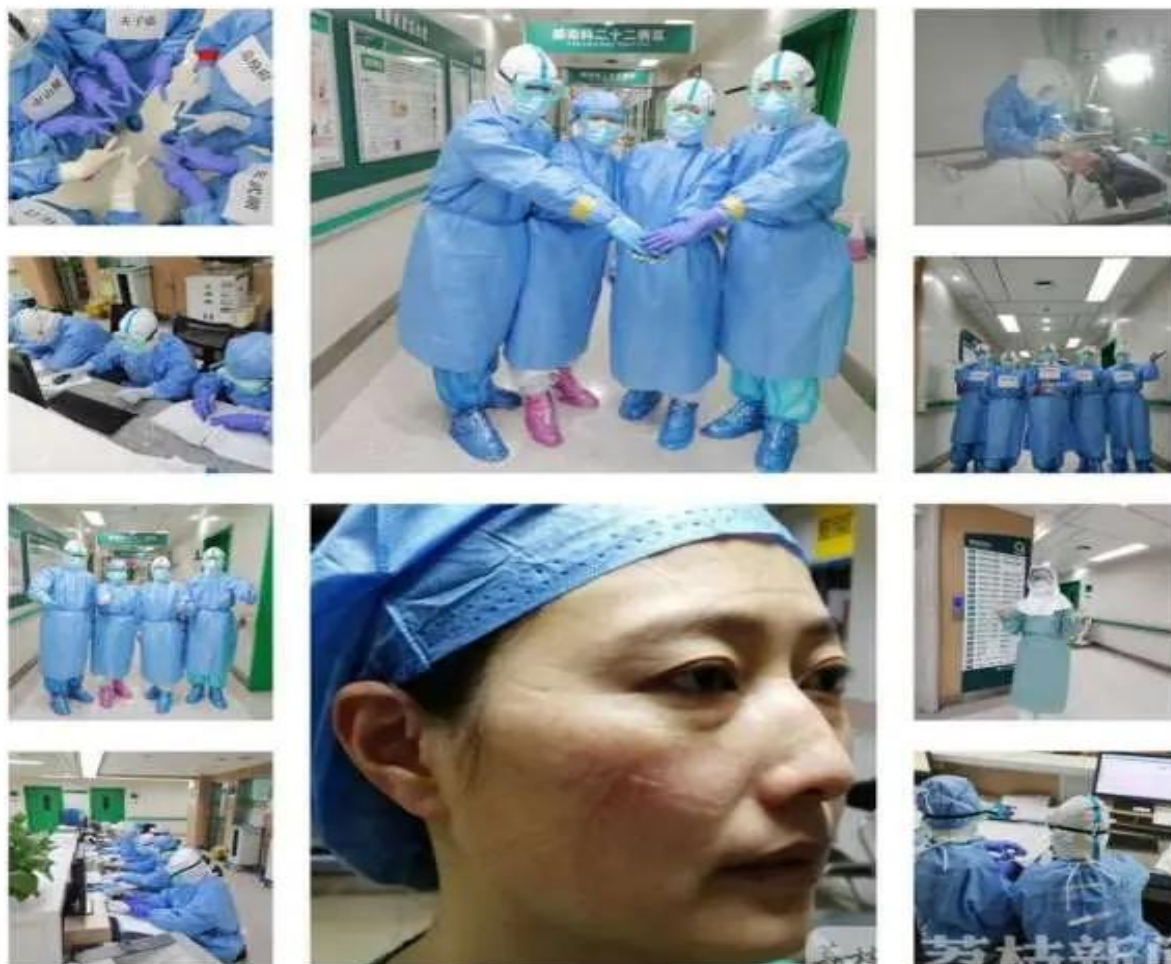
战斗在武汉疫情防控一线的“巾帼英雄”们