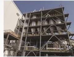
中盐吉兰泰48000KVA密闭电石炉炉气净化回收系统