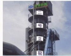
新疆天业立式烘干窑及配套脱硝除尘系统