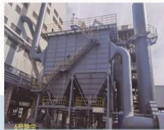
中泰化学40500KVA密闭电石炉前排烟除尘系统