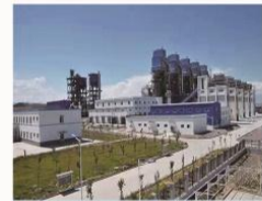
新疆博乐天博辰业8*600T石灰窑配套除尘系统

☎ 电话：0551-63359157 汪先生：13956932003 韩先生：13514963666