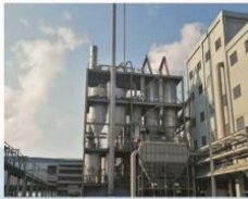
安徽华塑40500KVA密闭电石炉炉气净化回收系统