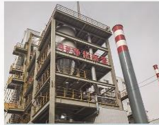
内蒙古君正81000KVA密闭电石炉炉气净化回收系统