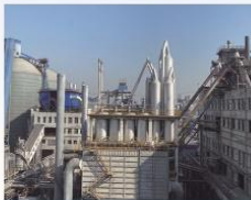
信发集团48000KVA密闭电石炉炉气净化回收系统