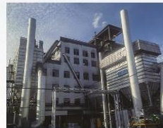
新疆天业40500KVA密闭电石炉厂房排烟除尘系统