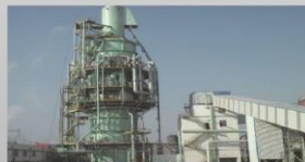
石灰窑—意大利·特鲁兹-弗卡斯